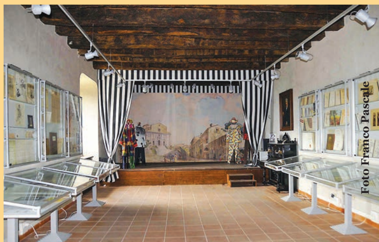
Museo Leoncavallo, Montalto Uffugo