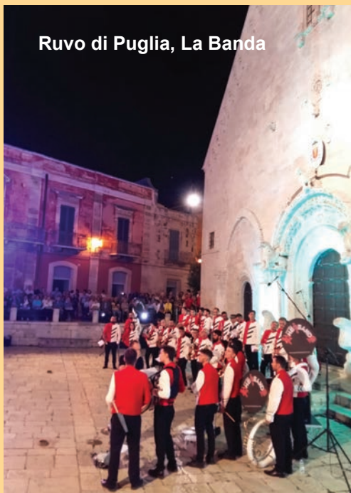
Ruvo di Puglia, La Banda