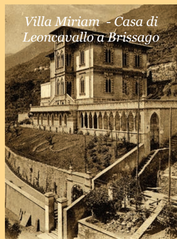
Villa Miriam - Casa di Leoncavallo a Brissago

Ma allora, a 100 anni dalla morte avvenuta a Mon-