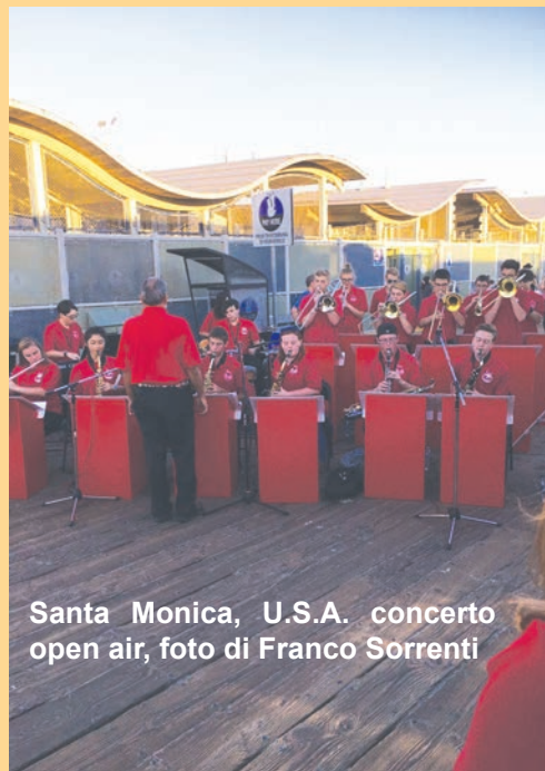
Santa Monica, U.S.A. concerto open air, foto di Franco Sorrenti

menti del suono. Non pietrificati come statue ma viventi perchè comunicano tuttora. Luoghi sonori anche tramite la loro postazione. E resi sonori per la presenza live di un musicista di strada, di uno stereo in sottofondo/ di cose, come alla casa di Mozart a Salisburgo. Roba da sindrome di Stendhal.