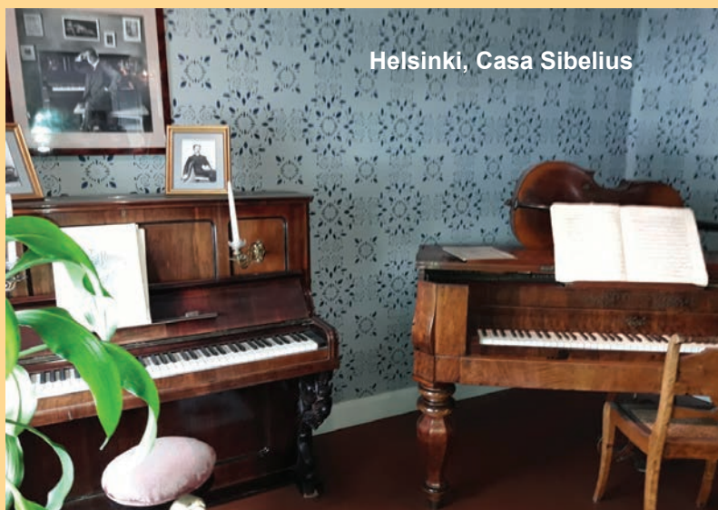
Helsinki, Casa Sibelius