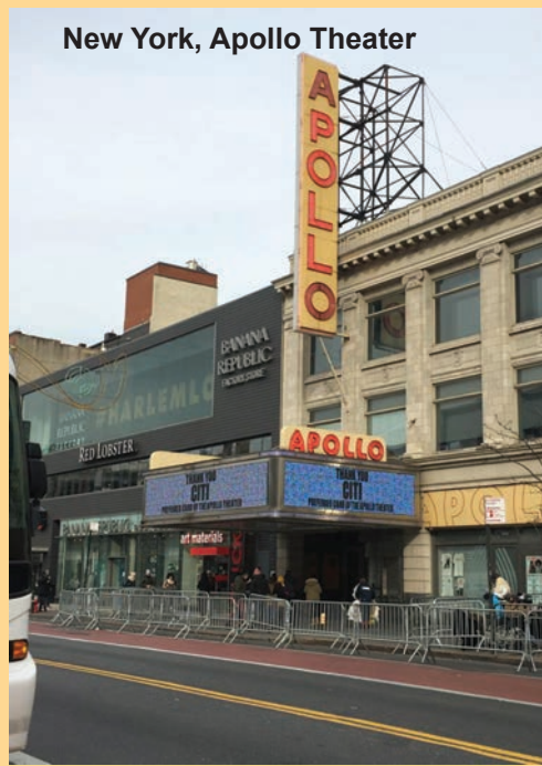
New York, Apollo Theater